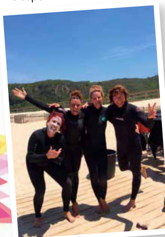
Die Let it Flow „surfers“